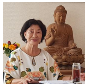
Grand Master Fan Xiulan

MEDITASJONSRETREAT Kvantehelsemetoden Lørdag 9. september kl 10.00 - 17.30 Søndag 10. september kl 10.00 - 16.00 Sted: Norsk Taiji Senter, Kirkegata 1, Oslo Pris: Kr 2200 - Åpent for alle